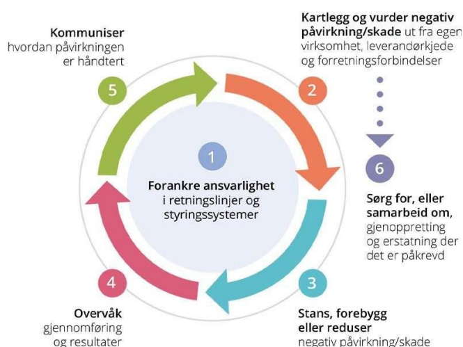
Figur 1. OECDs retningslinjer for ansvarleg næringsliv.

Aktsemdvurderinga i åpenhetsloven skal utførast i tråd med OECDs retningslinjer for ansvarleg næringsliv. Prosess er illustrert i figur 1.